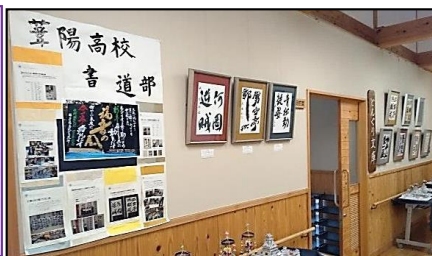
【葦陽高校書道部作品展】